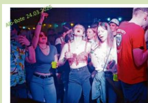
Alb-Malleparty bringt die Hallenwände zum Beben